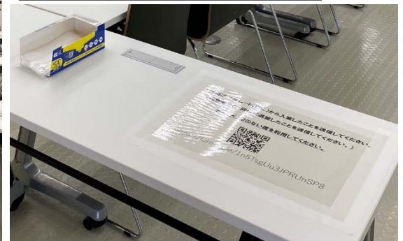
利用者の入退室時間と名簿管理