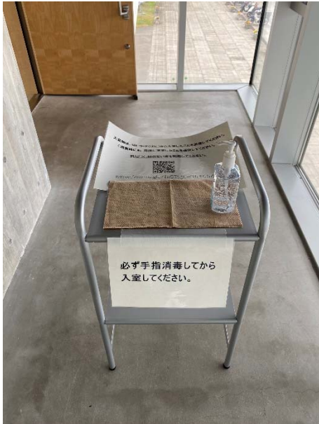
出入口部への手指消毒用アルコールの設置