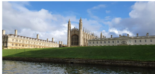
ケンブリッジ大学工学部