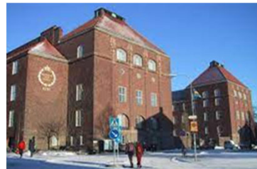
スウェーデン王立工科大学