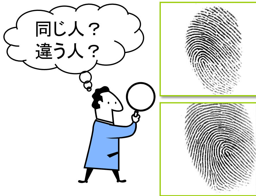
指紋画像を用いた個人認証 (バイオメトリクス認証)