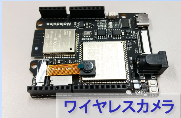
ワイヤレスカメラ