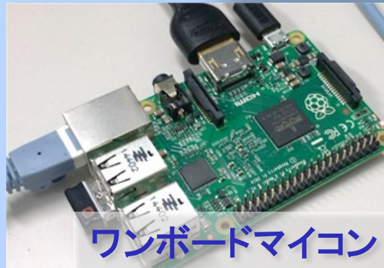
ワンボードマイコン