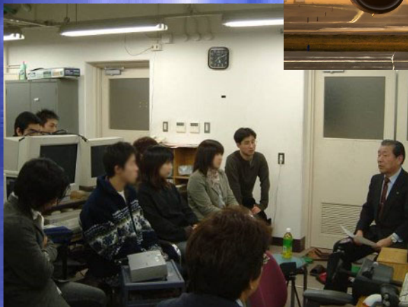
元・先任機長による特別講義