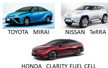
図1 燃料電池自動車 (FCV)

近年、温暖化現象や化石燃料の枯渇などの地球規模における問題から、水素を中心としたエネルギー社会（水素社会）の構築が望まれています。水素は将来的には太陽電池などの再生可能エネルギーで得られた電力から水の電気分解により生成することが理想的です。また、水素を消費する際も、水素のもつ化学エネルギーを電気エネルギーに高効率に変換する燃料電池での使用が期待されており、特に自動車の動力源としての普及が期待されています（図1）。