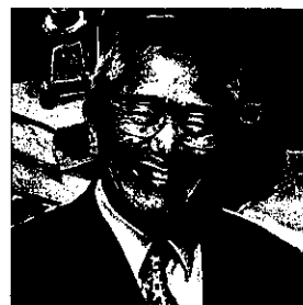
米バデュー大学 根岸 英一特別教授 (帝人グループ名誉フェロー) 帝人久村奨学生第5回生(1957年)

そして自らの「夢」を見つけたら真理を突き詰めるまで、とことんチャレンジしてください。今後の皆さんの大いなる活躍に期待しています。