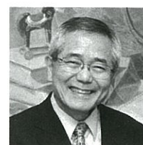
Purdue University Distinguished Professor Mr. Ei-ichi Negishi (Teijin Group Distinguished Fellow) 5th year Teijin Kumura scholarship (1957)

When you find your own "Dream", please challenge it thoroughly until the truth is investigated. I look forward to your great success in the future.