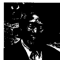
Purdue University Distinguished Professor Mr. Ei-ichi Negishi (Teijin Group Distinguished Fellow) 5th year Teijin Kumura scholarship (1957)

*This message was contributed in November 2013.