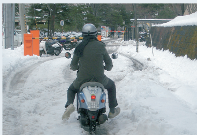
降雨降雪・凍結 スピード注意 スリップ・転倒注意

自転車やバイクの運転には常にさまざまな危険が伴います。 また雨天時や冬の積雪・凍結など路面状態が悪いときには、坂道だけでなく平地でも転倒など事故が起こりやすくなります。 交通事故から身を守るためにも、交通ルールを守り、無理の無い運転を心掛けましょう。